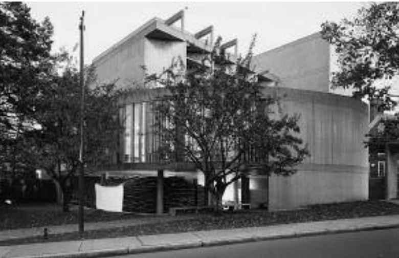
Das Puppentheater schmiegt sich an das Carpenter Center in Cambridge (1961), füllt einen ungenutzten Raum und stellt eine Verbindung zwischen Natur und Konstruktion her.