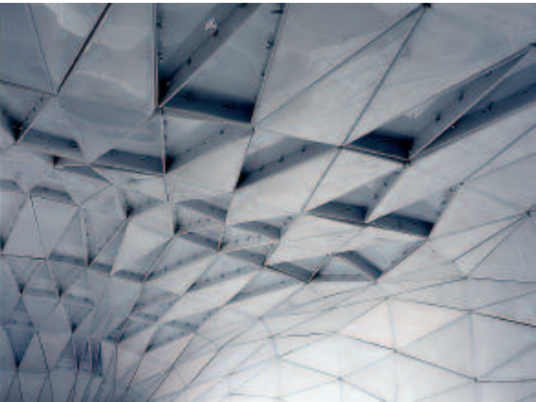
oben: Anhand des Modulrasters kann man die organischen Formen des kleinen Theaters nachvollziehen. Die Materialoberfläche erzeugt vielfältige Spiegelungen und ergibt ein homogenes Gesamtbild