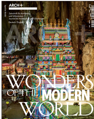
ARCH+ 259 Wonders of the Modern World April 2024