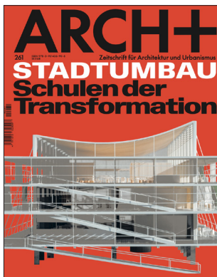
ARCH+ 261 Stadtumbau – Schulen der Transformation September 2024