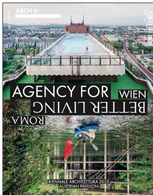
ARCH+ 260 Agency for Better Living Wien Rom Juli 2024